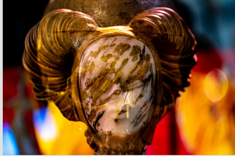
Yksityiskohtat pienoismallista ja hovimiehen puvusta Igor Stravinskin oopperaan Satakieli , Suomen kansallisooppera ja -baletti 1992.