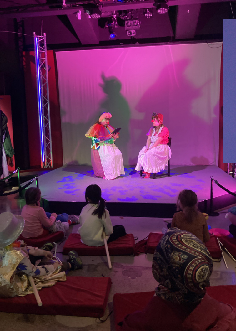
Syksyn Perhepäivän ohjelmassa oli Klovniduo Hertan ja Martan tarinoita ja temppuja.

Kaapelimuseot jatkoivat yhteisten Perhepäivien järjestämistä. Keväällä teemana olivat kuva ja kierrätysmateriaalit, syksyllä tarinat, muistot, tunteet ja tuoksut.