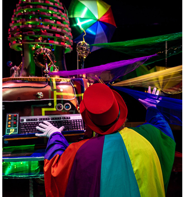
Kulttuurin kummilasten ohjelmassa oli vuonna 2025 Sateenkaarikone-työpajoja.

Huimaa! Sirkuksen taikaa ja tarinoita -näytelyyn suunniteltiin opastus sekä Sirkusseikkailu -työpajat päiväkodeille ja alakouluille. Pienempien tehtävänä oli selvittää kommellusten ketjureaktio ja etsiä klovniä kadonneet nenät. Alakoululaisille suunnatun työpajan lähtökohtana toimivat inspiroivat tarinat suomalaisten sirkustaiteilijoiden elämästä. Työpajojen päätteeksi kaikki sirkusseikkailijat luovat oman yllätys-sirkusnumeronsa ja pääsevät esiintymään. Työpajoissa käytetään museoturvallisia sirkusvälineitä sekä käyttökokoelman teatteri- ja sirkusasuja.