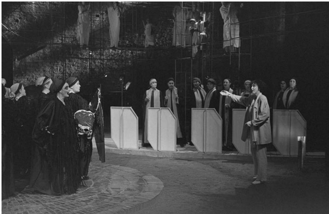
Oresteia 1991. Raivoisat Ruusut. Ohjaus: Ritva Siikala.

mion vallassa (Agave surmaa oman poikansa Pentheuksen). Tiedostamaton ja hallitsematon pahuus on yksi tämänkin tragedian teemoista.