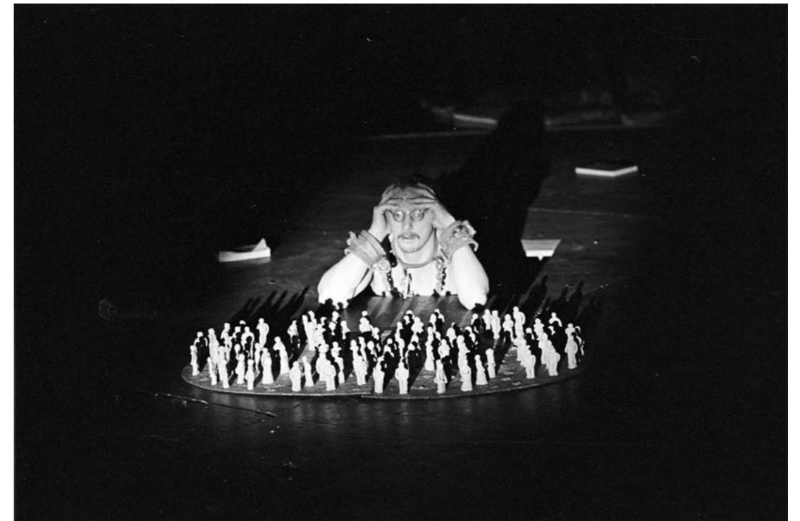
Prometeus 1985. Helsingin Kaupunginteatteri. Ohjaus: Jotaarkka Pennanen.

Emootiot ja uskomukset liittyvät kiinteästi yhteen kreikkalaisessa filosofiasa. Tunteet eivät ole järjen toimintaa häiritseviä sokeita voimia, vaan läheisessä suhteessa uskomuksiin. Uskomukset ovat oman kontrollin ulkopuolella olevien tekijöiden vaikutusta elämään. Nämä tekijät saattavat yksilön tahdosta riippumatta vaikuttaa hyvän elämän toteutumiseen. Tämä tragedian myyttinen malli on osa Aristoteleen tunneteoriaa. Emootioihin liittyvä uskomus on sen olennainen osa. Emootioita voi synnyttää, muovata ja poistaa vaikuttavan argumentaation avulla. 2 Tämä tapahtuu luonteen ( ethos ), emootioiden ( pathos ) ja argumenttien ( logos ) yhteisyydessä. 3 Taitava oraattori esittää itsensä järkevänä, moraaliltaan korkeatasoisena ja kuulijoihin hyväntahtoisesti suhtautuvana. Samalla hän yrittää saada aikaan sellaisia tunteita, jotka ohjaavat myönteiseen suhtautumiseen puhujan ehdotuksiin. Näitä ehdotuksia eli näkemyksiä puhujan on perusteltava uskottavasti. Nämä Retoriikassa 4