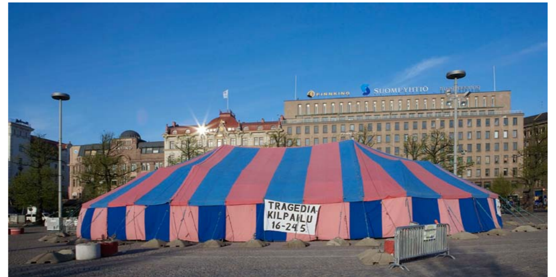
TeatteriTelta 2008.

Yksi jännittävimmistä tilaisuuksista, joissa antiikin tragediaa on viime vuosina Suomessa nähty, oli Myllyteatterin ja sen taiteellisen johtajan Miira Sippolan organisoima TeatteriTelta-tragediafestivaali Helsingin Rautatientorilla toukokuussa 2008. Rautatientorille pystytetyssä suuressa teltassa nähtiin seitsemänä esitysiltana kolme tragediaa peräkkäin. Kuten