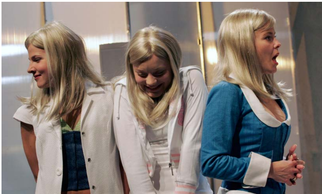
Julmaa ja hellää 2005. Suomen Kansallisteatteri. Ohjaus: Esa Leskinen.

Taplinin mukaan juuri näihin esteettisiin elementteihin monet ohjaajat ja visuaaliset suunnittelijat ottavat nykyesityksissä tavalla tai toisella kantaa. 1